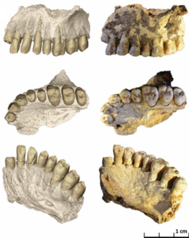
Figure 2 : Vues latérale, occlusale et oblique du maxillaire gauche (Misliya-1) découvert dans le gisement de Misliya Cave. Sont visibles à gauche les reconstructions virtuelles et à droite, le spécimen original.